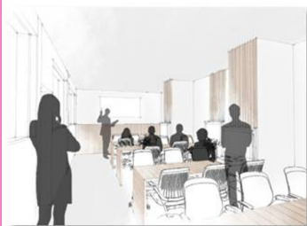
Aménagement d'un espace pédagogique innovant: Learning Lab

La taxe d'apprentissage se situe au cœur des enjeux du numérique et valorise les projets novateurs, tournés vers les nouveaux modes de transmission du savoir.