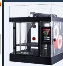
CRÉATION D'UNE PLATEFORME PÉDAGOGIQUE D'IMPRESSION 3D